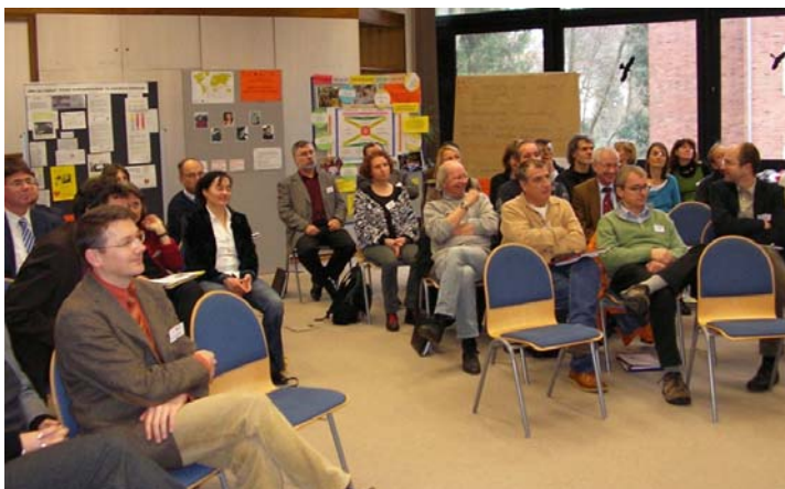
Blick ins Plenum der Tagung

Die katholischen und die evangelischen Hochschul- und Studierendengemeinden leisten mit ihren sozialen, kulturellen und religiösen Angeboten einen wichtigen Beitrag zur Integration ausländischer Studierender. Mit ihren psychologischen Beratungsleistungen und materiellen Unterstützungsmaßnahmen tragen sie dazu bei, dass ausländische Studierende trotz Notsituationen ihr Studium zum Abschluss bringen können. Als engagiert Handelnde beobachten die Kirchen die Veränderungen der Internationalisierung an den Hochschulen aufmerksam und kritisch. Sie setzen sich für eine sozial ausgewogene Entwicklung der Internationalisierung ein und wollen deren entwicklungspolitische Komponenten stärken. Als Partner der Hochschulen und der Studentenwerke können die Hochschul- und Studierendengemeinden wichtige Aufgaben bei der Integration ausländischer Studierender mit übernehmen. Eine stärkere Vernetzung dieser drei Akteure kann wesentlich zur Verbesserung der Integration ausländischer Studierender beitragen.