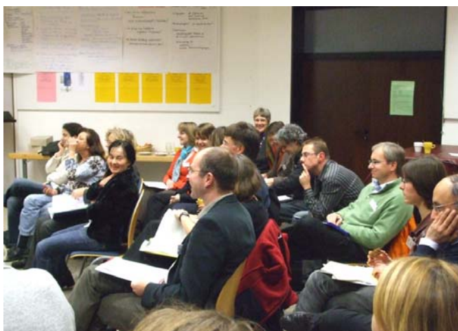
Interesse bei den Teilnehmenden

Für Studierende, die frei nach Deutschland eingereist sind, bieten die Seminare des Studienbegleitprogramms (STUBE) interessante Möglichkeiten, sich interkulturelle Kompetenzen und entwicklungspolitische Kenntnisse zu erwerben. Die STUBE-Angebote werden je nach Bundesland in verschiedenen Kooperationsformen von evangelischer und katholischer Seite und durch den World University Service getragen und teilweise mit Landesmitteln unterstützt.